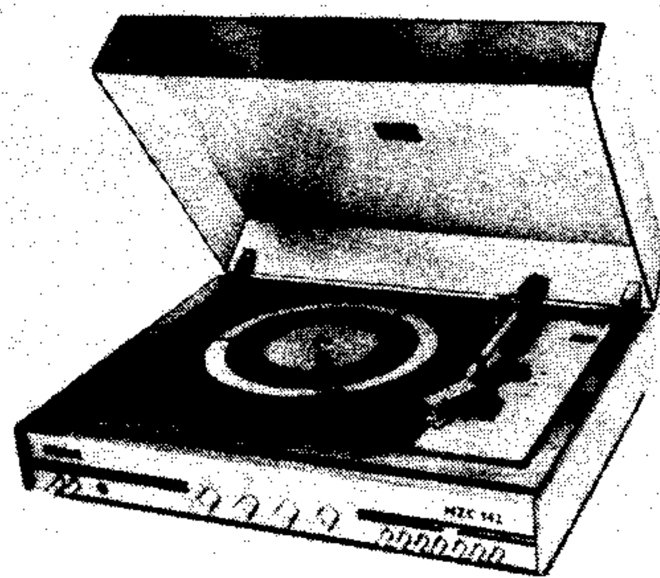
Stolní stereofonní gramofon NZC 142, výroba 1973 až 1976

Vstupní napětí (pro vybuzení na jmenovitý výstupní výkon): pro piezoelektrickou stereofonní přenosku —