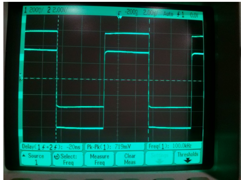
U_{be} = 12 \text{ Vpp} U_{ki} = 719 \text{ mVpp} relék fesz. osztása = -37 dB